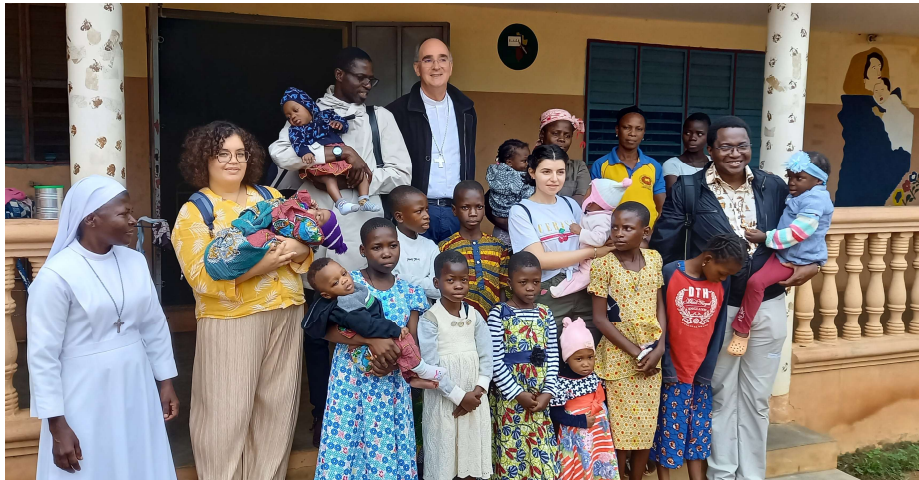
Visite de l'orphelinat de Ste Thérèse de l'enfant Jésus de TCHATCHOU

J'ai eu la chance de faire partie de la délégation nantaise, pour un séjour au Bénin durant deux semaines en août.