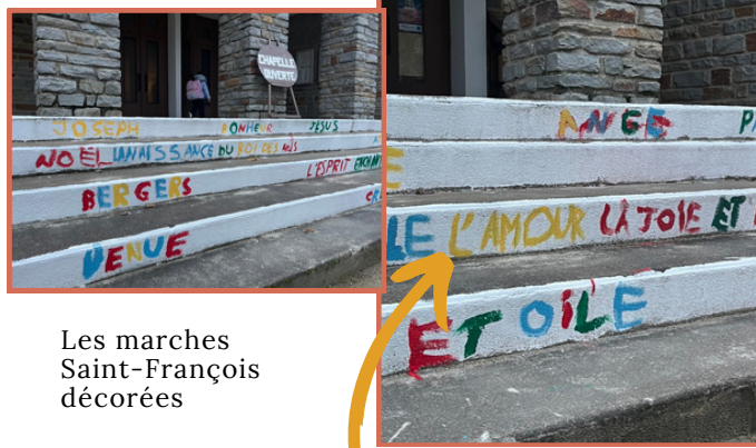
Les marches Saint-François décorées