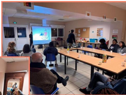
Le groupe des étudiants