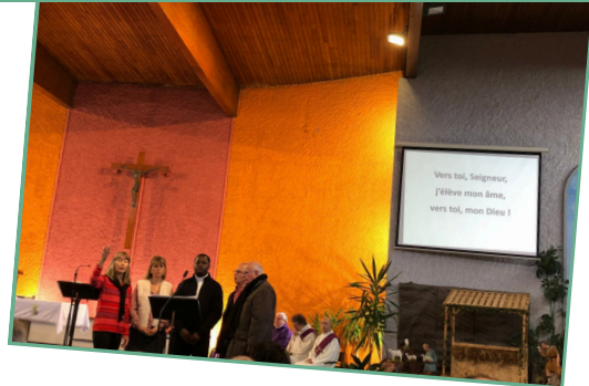
Messe unique du 1er dimanche de l'aveit