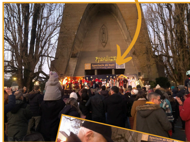
Bravo les enfants !