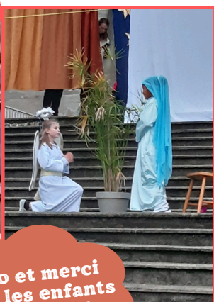
Bravo et merci à tous les enfants et aux bénévoles