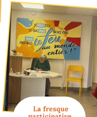
La fresque participative des 20 ans est accrochée dans la maison paroissiale!