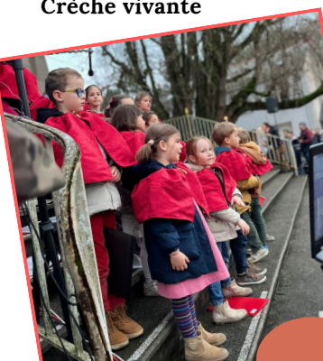
Bravo et merci à tous les enfants et aux bénévoles