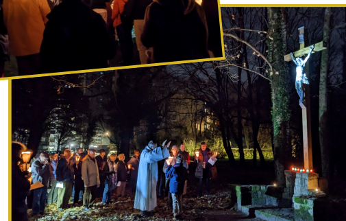
Soirée du 8 décembre, avec la bénédiction du calvaire de la grotte restauré