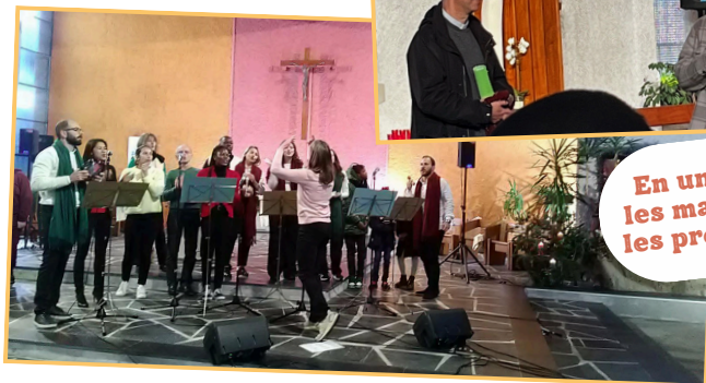
En union avec les maronites et les protestants