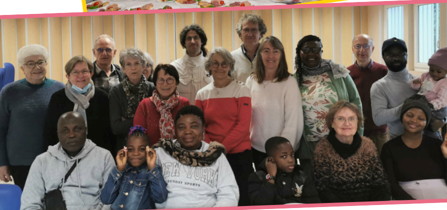
AFM et les familles accueillies