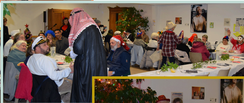
Réveillon en paroisse