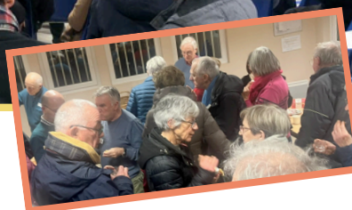
Temps de partage et de remerciement des bénévoles autour de galettes.