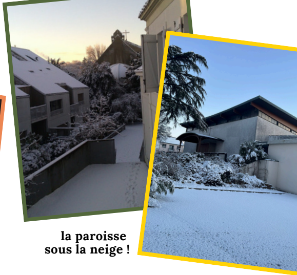
la paroisse sous la neige !