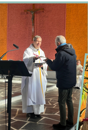
Messe de l'Épiphanie avec remise de la lettre de mission au nouvel économe paroissial