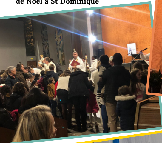
Célébration de la veillée de Noël à St Dominique